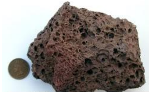
Papier toilette islamique