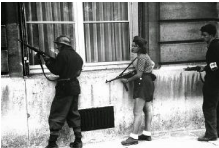
Francuski ruch oporu

To nie są spekulacje „zwarowanych zwolenników teorii spiskowych ”, to udowodniony, dobrze udokumentowany fakt historyczny.