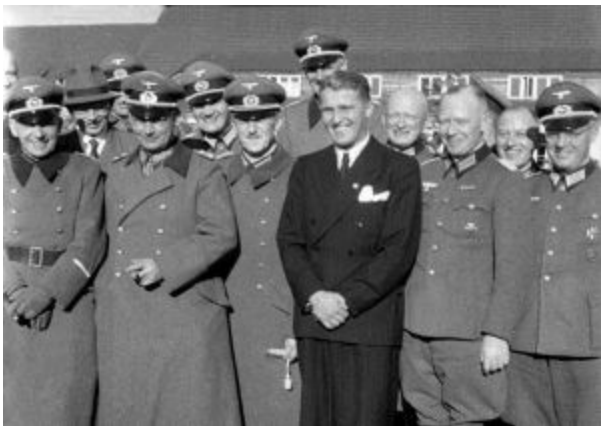
Wernher von Braun

Niektóre z tych tak zwanych jednostek paramilitarnych „pozostających w tyle” zostały zbudowane wokół grup oporu, które już istniały, zwłaszcza w krajach skandynawskich. Gdzie indziej tworzone nowe jednostki, wykorzystując lokalne zasoby i aktywistów, często włączając skrajnie prawicowych ekstremistów. Ani OSS, ani SOE nie były przeciwne wykorzystywaniu neonazistowskich terrorystów jako agentów. Komunizm był postrzegany jako większe zagrożenie. Jego państwowy ateizm zagrażał Kościołowi rzymskokatolickiemu, marksizm zagrażał kapitalizmowi, a władza banków i jego przywiązanie do międzynarodowego socjalizmu (proletariackiego internacjonalizmu), skupione na walce klasowej, zagrażały hierarchii zachodniego establishmentu. Bardziej niż sam Związek Radziecki, to potencjalne rozprzestrzenianie się ideologii komunistycznej zaczęło być postrzegane jako główne zagrożenie. Coś, czemu należy się przeciwstawić za wszelką cenę.