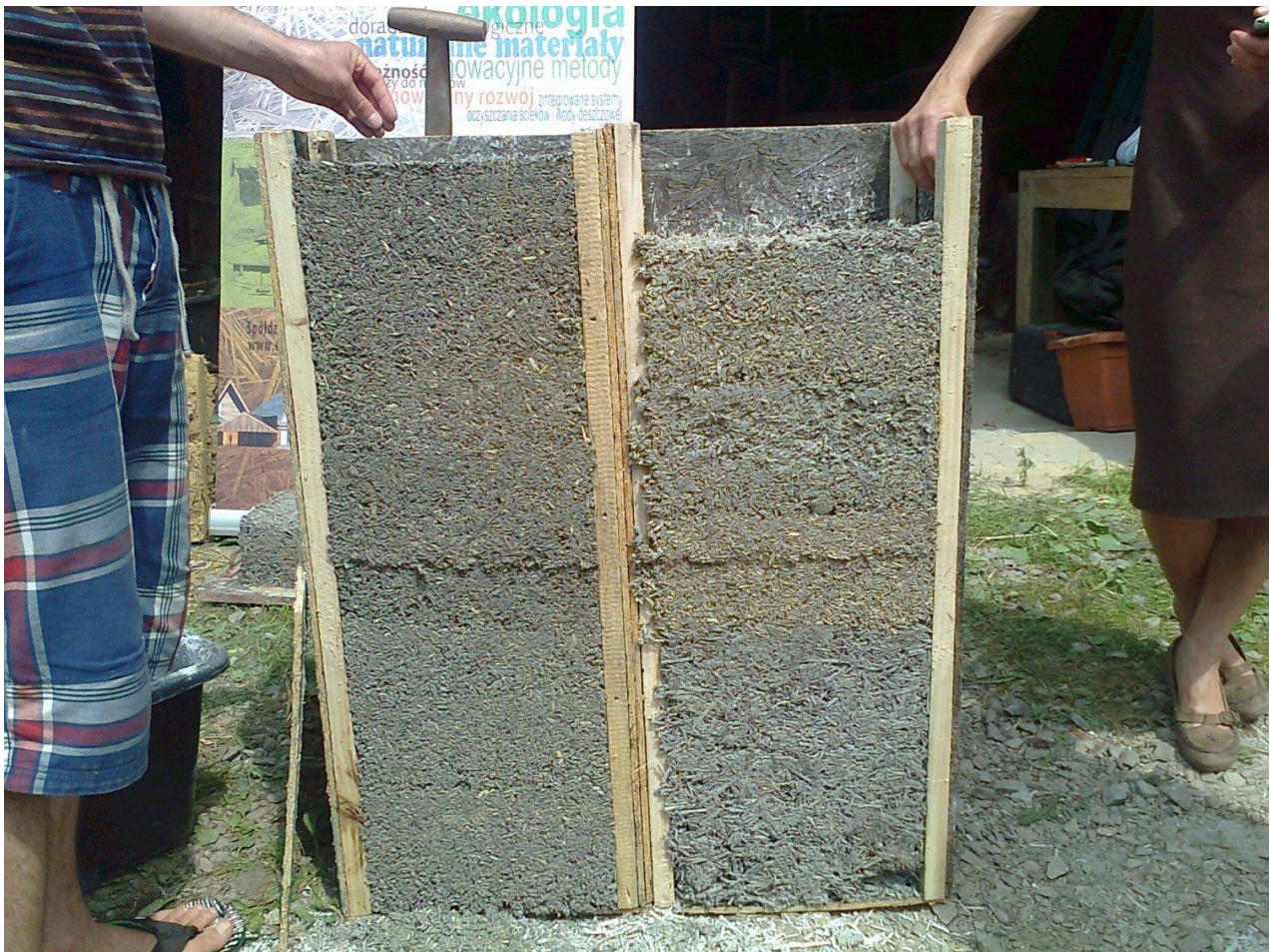
Zdj.4. Zaprawa w szalunku