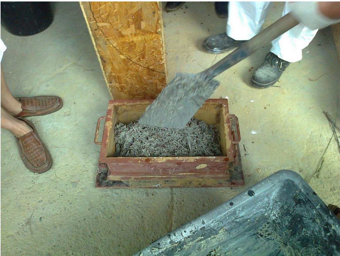
Zdj.3. Ubijanie zaprawy w formie