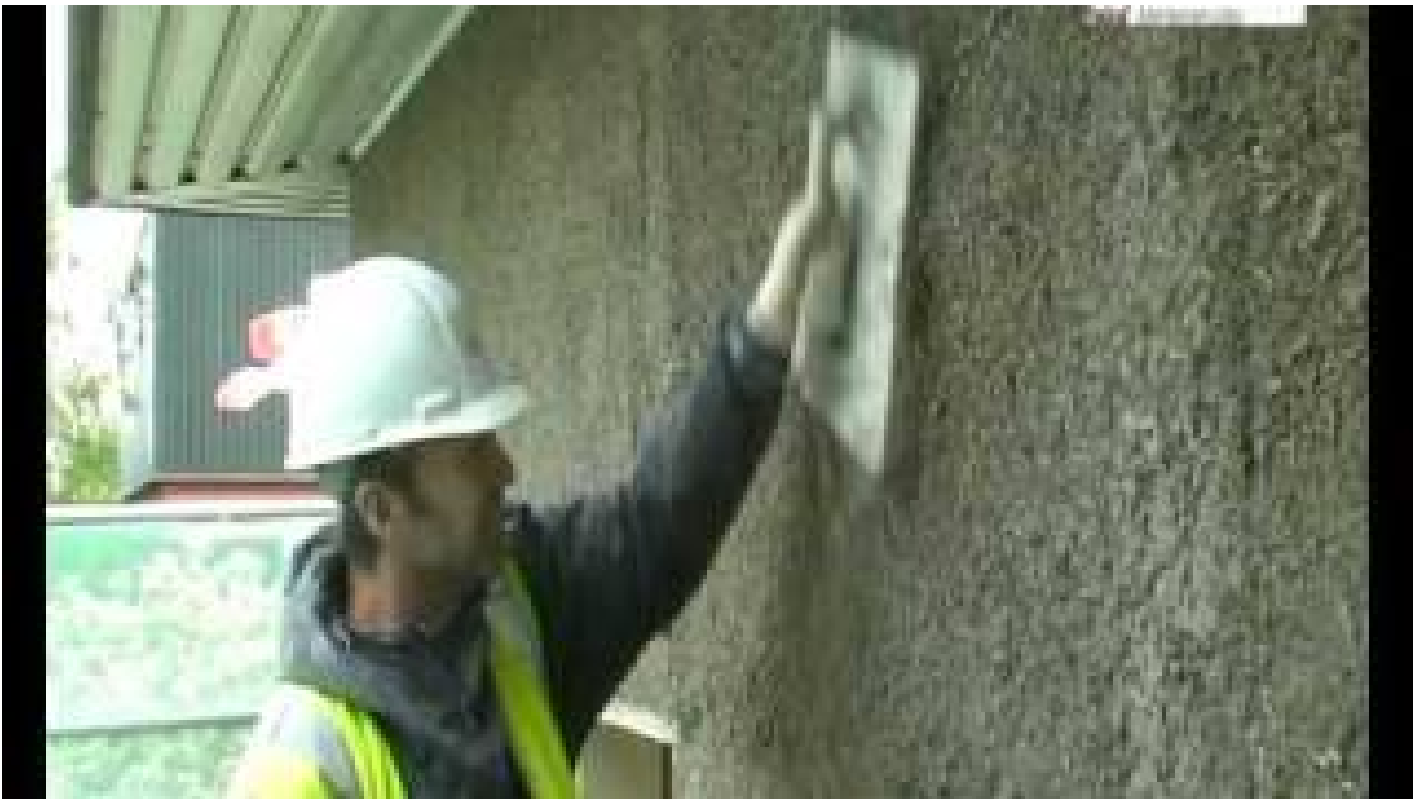
Building with Hempcrete: