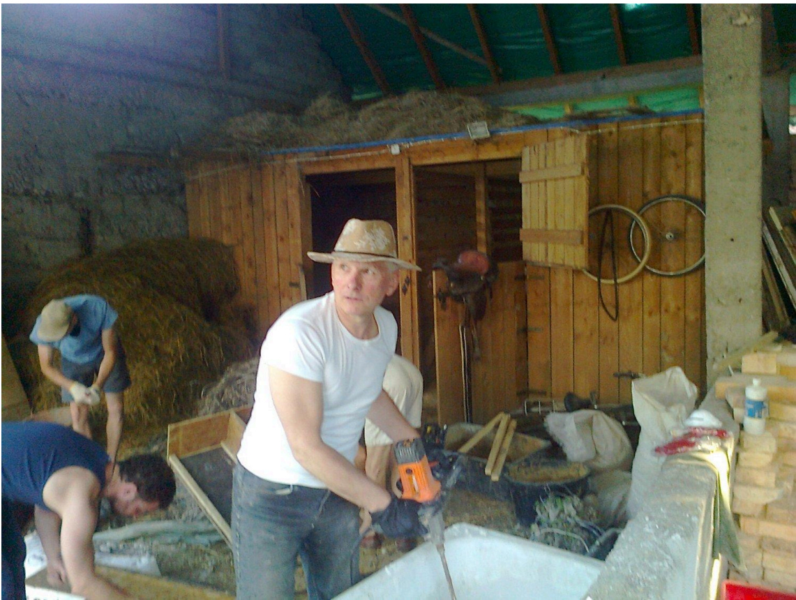
Zdj.1. Autor przy pracy :)