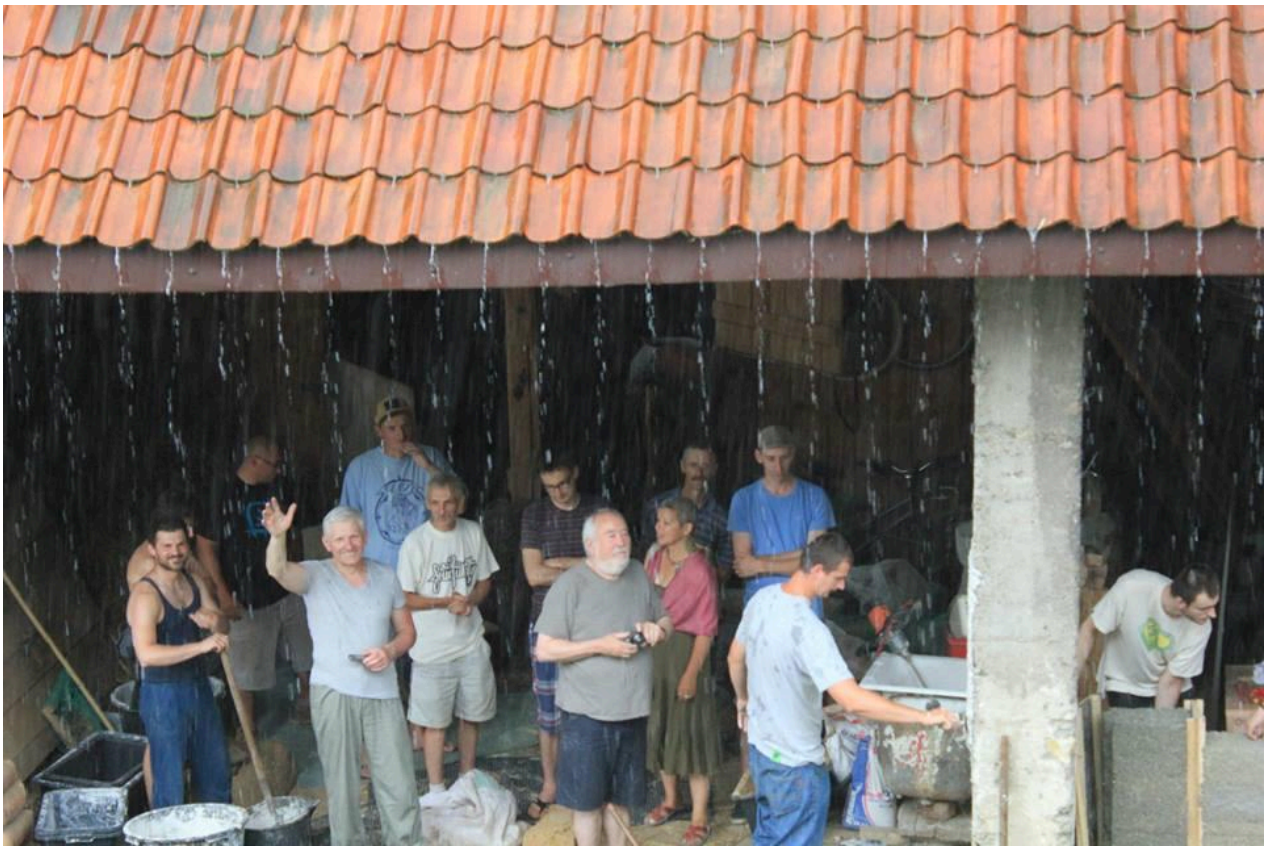
Zdj.5. Na koniec ostro wlało... :)

Zdjęcia ze zbioru autora (foto: Anna Dolińska) oraz