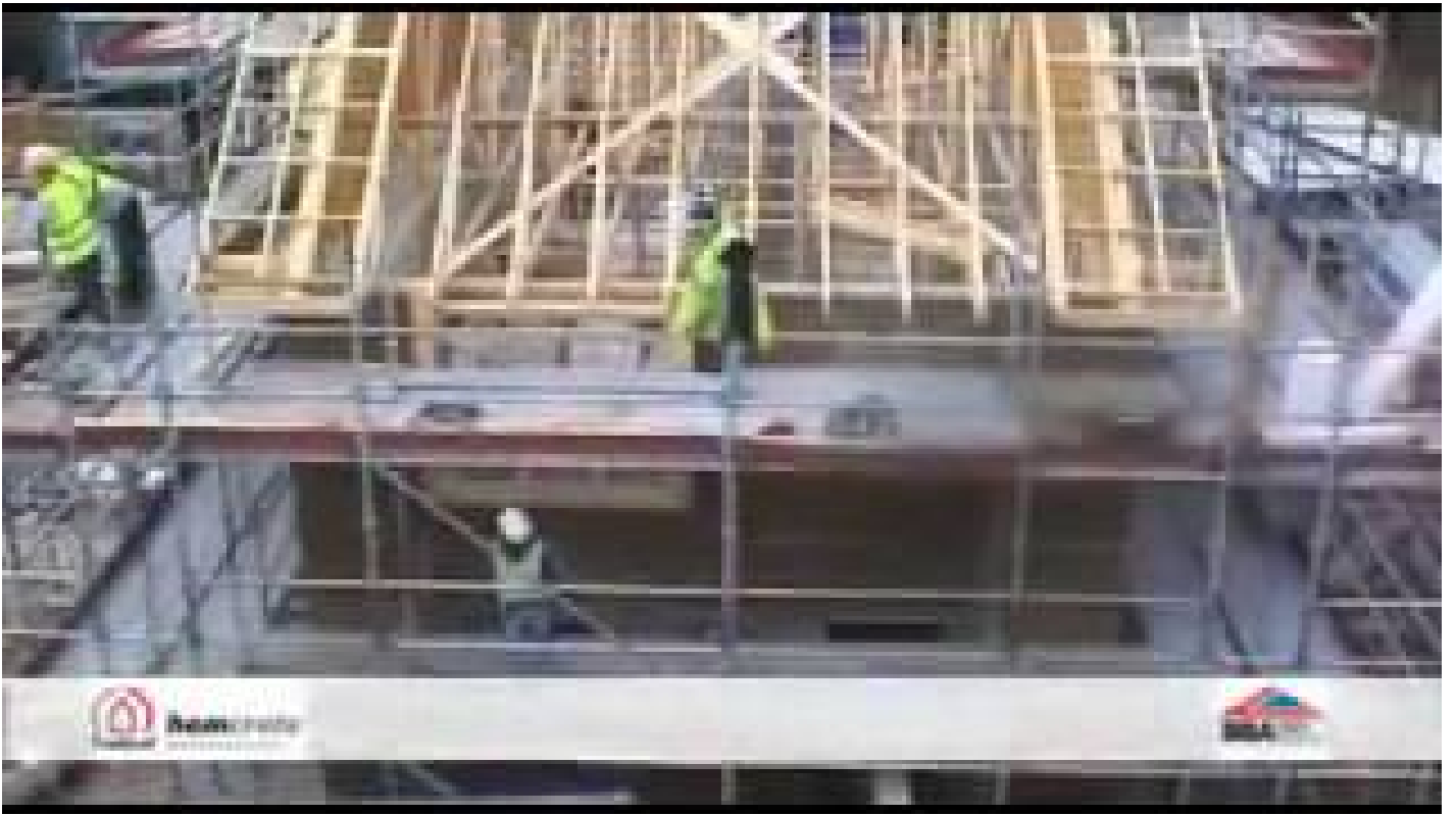
Spray Applied Hempcrete: