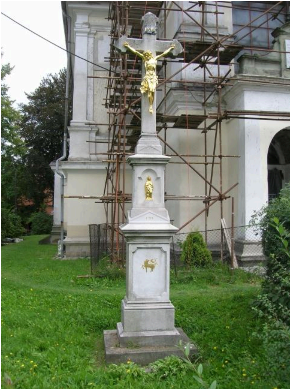
Krzyż przed kościołem