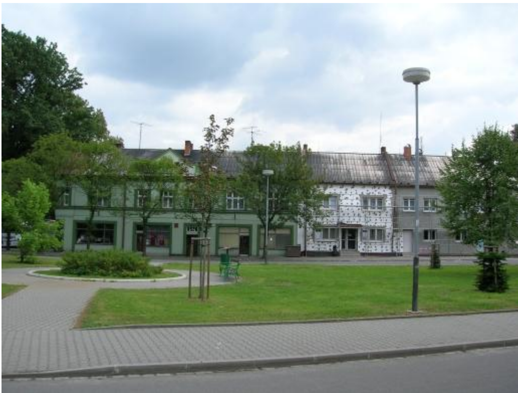
Jeszcze raz Rynek