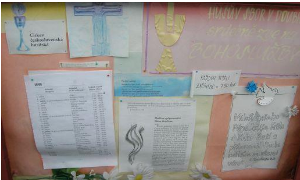
Husycka gablotka parafialna