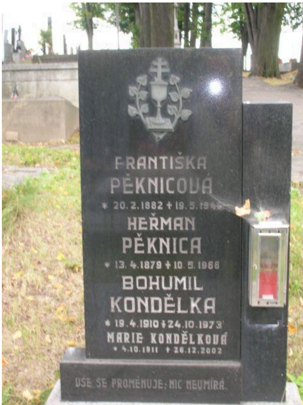
Inny husycki nagrobek