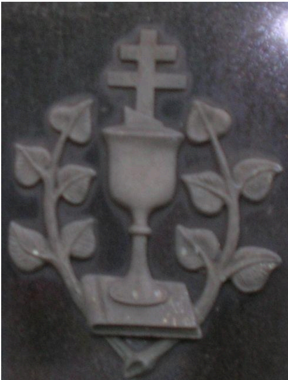
Husyci symbol z nagrobka