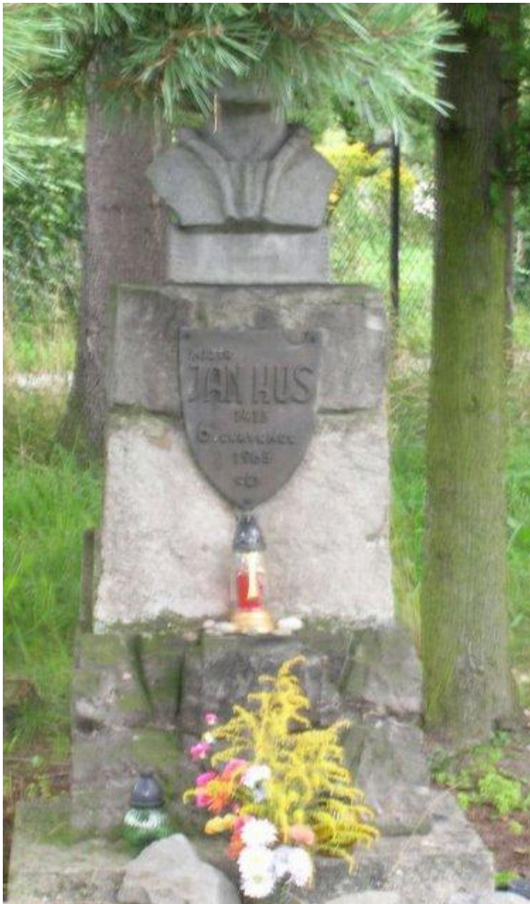
Pomník Jana Husa