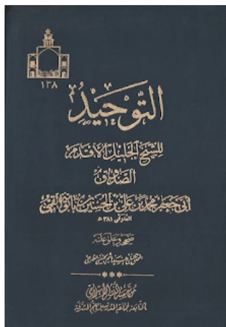
Le Kitâb al-Tawhîd de shaykh al-Sadûq (m. 381)

Cette série consistera en une introduction, traduction complète et commentaire du chapitre 41 du célèbre Kitâb al-Tawhîd (« Le Livre de l'Unicité ») du grand muhaddith et juriste-théologien shaykh al-Sadûq (m. 381/991), que Dieu lui fasse Miséricorde. Nous avons jugé préférable de faire une série d'articles par soucis de lisibilité. La première partie concerne l'introduction et la traduction complète du chapitre. Les articles suivants consisteront en le commentaire des dix ahadîth traduits ici.