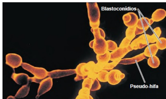
(c) Os blastoconídios são formados a partir de brotos de uma célula parental de Candida albicans . MEV 10 µm