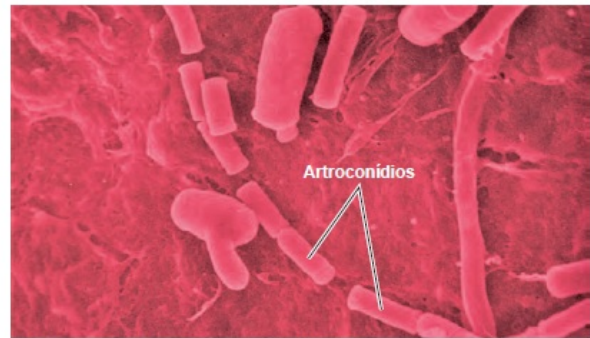
(b) A fragmentação da hifa resulta na formação de arthroconídios em Coccidioides immitis . MEV 5 µm