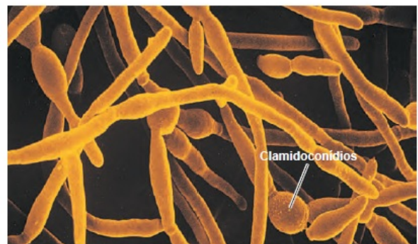
(d) Os clamidoconídios são células com paredes espessas no interior das hifas de C. albicans . MEV 10 µm

Viver Sem Candidíase Funciona Este contaminação tende a suceder quando nosso conjunto imunológico está anêmico, ou mesmo quando nossas boas bactérias não podem moderar os fungos. E tanto relevante como os alimentos antifúngicos, saudável os mantimento que aumentam a sua franquia. Salutar eles os responsáveis dentro de tornar sô estrutura física bastião e também totalmente protegido para proteção de os fungos da candida albicans.