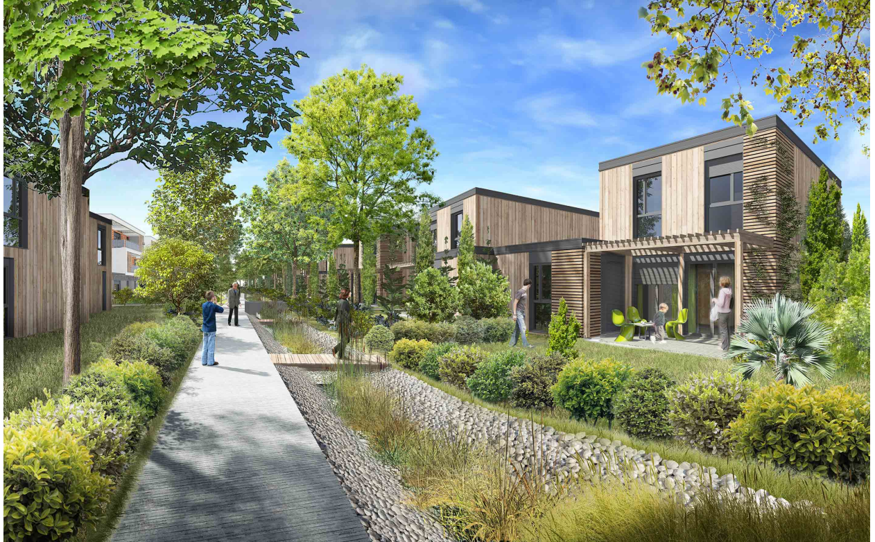
Plus: Trihab éco quartiers

d'éco-quartier. Une fois de plus, un appel à projets ne serait-il pas judicieux?