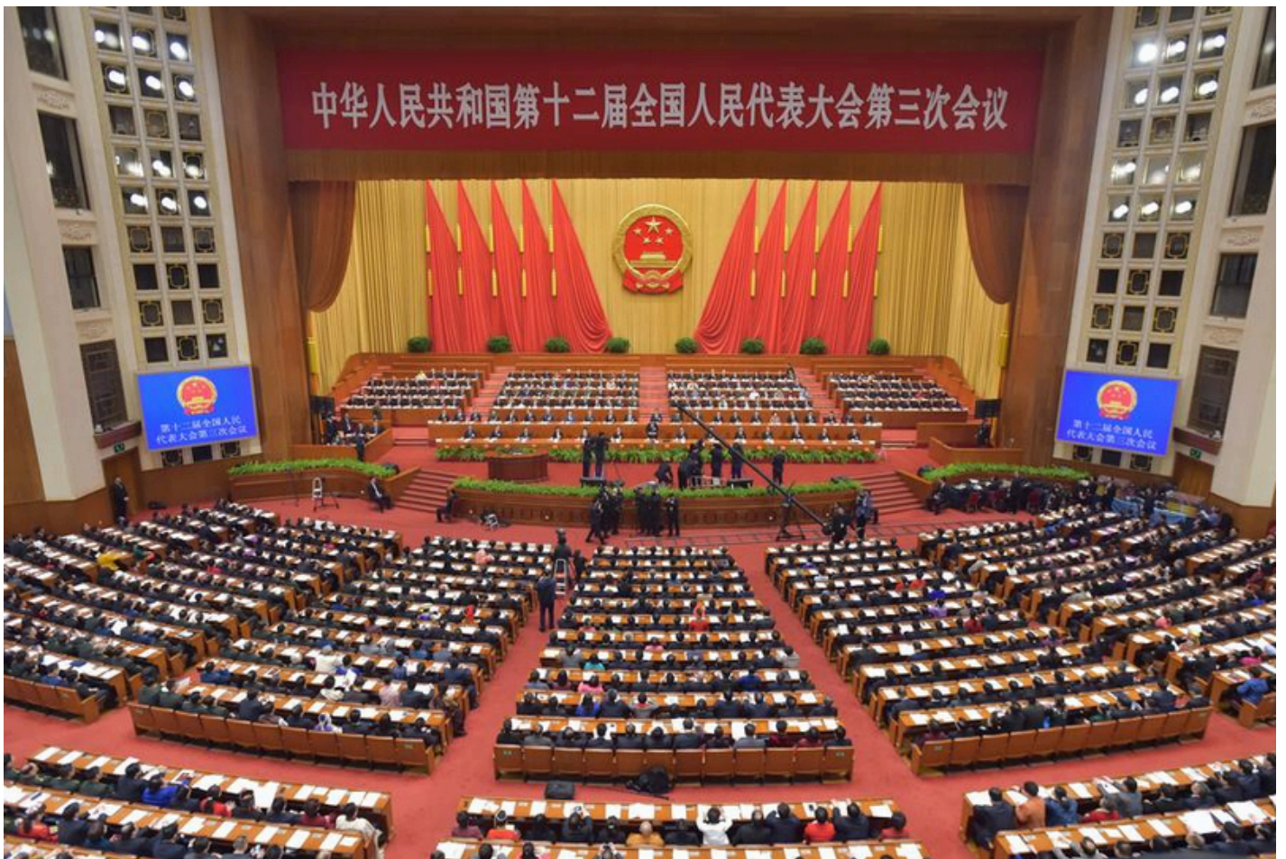
Το Εθνικό Λαϊκό Κογκρέσο της Κίνας

Χωρίς καμία δημοκρατική εποπτεία, η τεχνοκρατία στην Κίνα ορίζει ότι ο λαός εμπιστεύεται τα διατάγματα των τεχνοκρατών. Απαιτείται να πιστεύουν, ή τουλάχιστον να δηλώνουν δημοσίως, ότι οι αποφάσεις λαμβάνονται προς το συμφέρον του γενικού συμφέροντος. Αν δεν συμμορφωθούν, η Τεχνοκρατία μπορεί να χρησιμοποιήσει τα συστήματα επιτήρησης για να εντοπίσει τους παραβάτες και να τους τιμωρήσει για την εγωιστική τους συμπεριφορά.