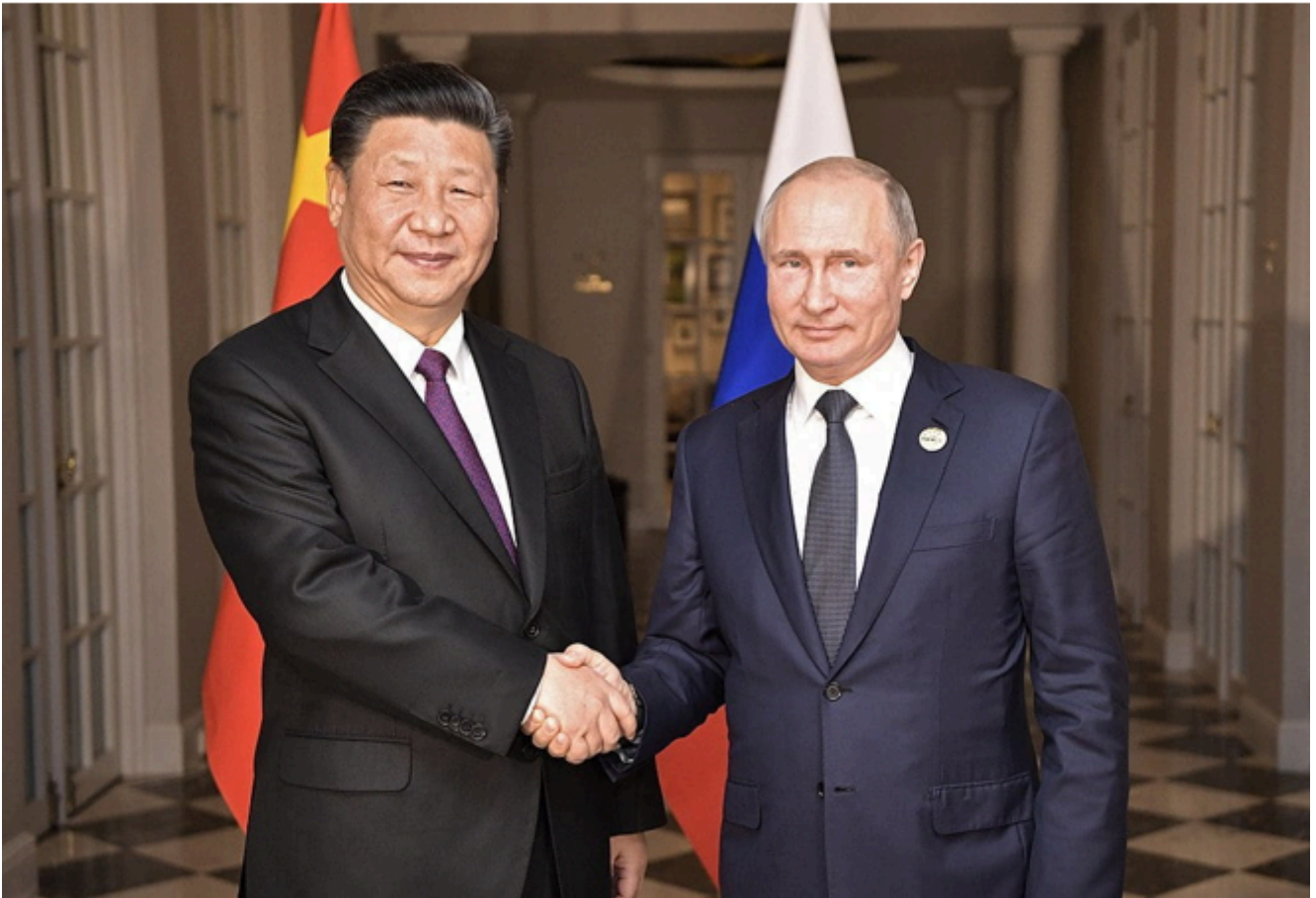
Ο Βλαντιμίρ Πούτιν και ο Σι Τζινπίνγκ το 2018

Αντιθέτως, η ομιλία της υπουργού Εξωτερικών του Ηνωμένου Βασιλείου Liz Truss στο Lowy Institute, ένα αυστραλιανό think-tank πολιτικής που υποστηρίζεται από τους Rothschild και επικεντρώνεται στην περιοχή Ασίας-Ειρηνικού, απεικόνιζε τη δυτική θέση. Η ίδια είπε: