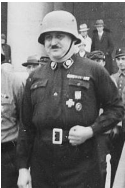
ХАЙНЦ ХАУЭНШТАЙН, ГЛАВА ФРАЙКОРА «ОРГАНИЗАЦИЯ

Немецкая пропаганда подливает масла в огонь: «французские офицеры избивают немецких рабочих, французские негры насилуют немок». Часть мюнхенских фрайкоровцев решает устроить в Рурском бассейне не пассивное, а активное сопротивление. Хайнц Хауэнштайн и Ганс Хайн, люди из верхушки организации, отправляются в Рур. Поддержку на месте обеспечивают Карл Кауфман и Эрих Кох.