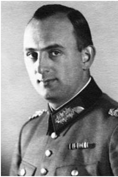
КУРТ ДАЛЮГЕ, ГЛАВА БЕРЛИНСКИХ СА

Утром 7 ноября на перрон берлинского вокзала сошел человек в черном френче из альпаки и бежевом плаще. Для Геббельса битва за Берлин началась. Победой в Берлине начался его взлет, поражением в Берлине — закончилась жизнь.