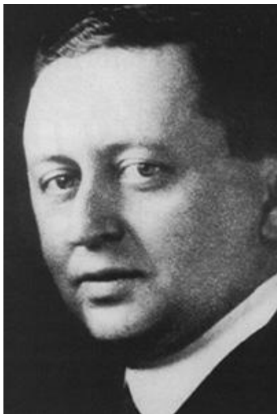
ЯКОБ ГОЛЬШМИДТ, ГЛАВА НАЦБАНКА ГЕРМАНИИ

завтра ее хозяин все узнает из газет. Берлинская полиция решила, что это уже слишком, деятельность партии в столице приостановили.